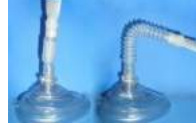
マウスピース使用