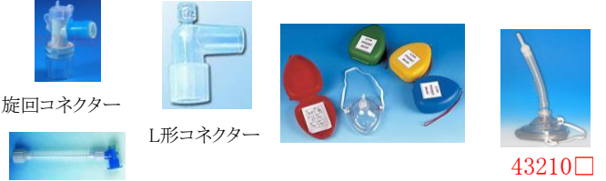
旋回コネクター L形コネクター 43210□