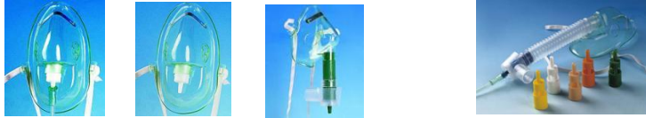
4111□□ 41120□ 2色調節管タイプ41B□□ 41B□□□ 送気ホース有 送気ホース無