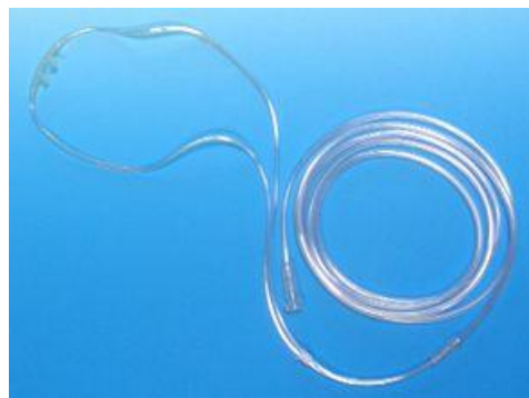
型番:S-015 鼻腔カニユーラ