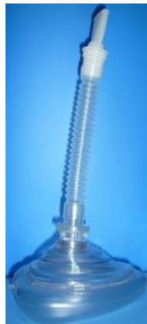
型番 S-006ポケットマスク (マウスピース使用)