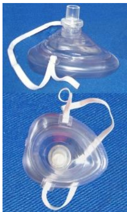
型番 S-005ポケットマスク(標準) ケース入り