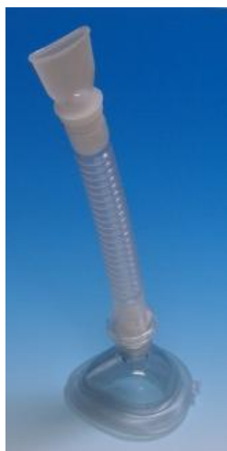
型番 S-007(乳児専用) マウスピース使用