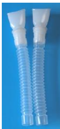
型番:S-005 蛇腹管(2個セット) ◆長さ13.5cm 17mmID