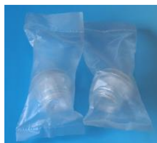
② 単回使用 型番:S-005 呼吸バルブ(2個セット)