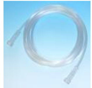
型番S-019気管切開マスク酸素チューブ2m付き