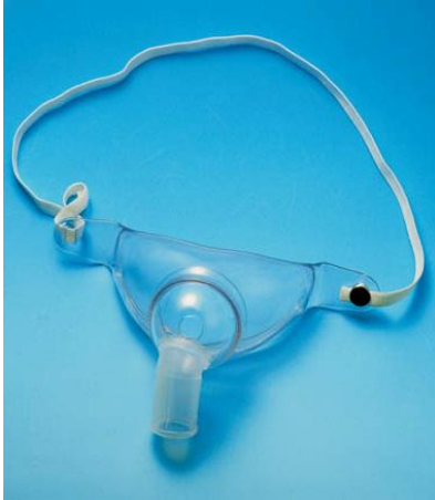
型番S-019気管切開マスク