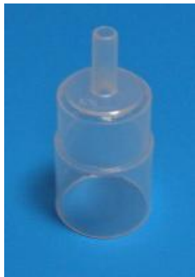
型番S-019気管切開マスク用コネクター