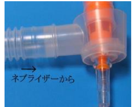
型番S-019気管切開マスクダイリ्यूタ付