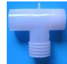
22M/15F 17F 22M/18F

構成:サイドドラフト式ネブライザキットに上記の付属部品を組み合わせて各全体構成図を実現する。