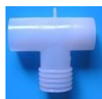
22M/15F 17F 22M/18F

構成:ネブライザキットに上記の付属部品を組み合わせて 全体構成図その1、その2、その3、を実現する。 なお本体及び各付属品は単体でも販売いたします。