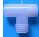
22M/15F 17F 22M/18F

構成:サイドドラフト式ネブライザキットに上記の付属部品を組み合わせて各全体構成図を実現する。